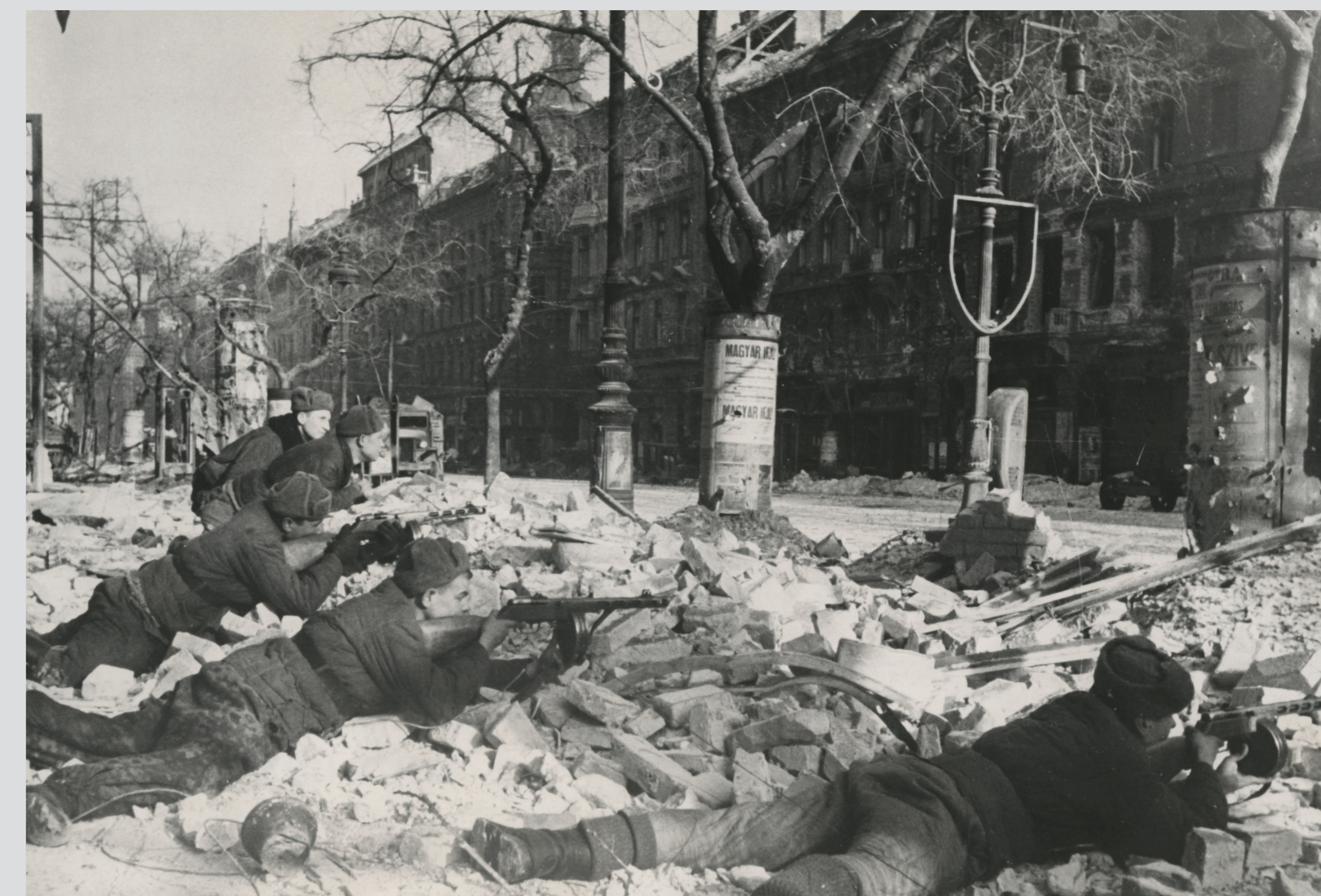
Budapest, Nagykörút, 1945. január Budapest, Grand Boulevard, January 1945

Four German (including two Waffen-SS) and three Hungarian divisions, as well as smaller and larger unit fragments, including artillery and anti-aircraft artillery batteries, various engineering subunits and construction companies were trapped in the surrounded capital. Moreover, five gendarmerie battalions, one police and two university assault battalions, the “Prónay” and “Vannay” Detachments, eight “Arrow-Cross combat squads”, the armed troops of the Arrow-Cross “Armed National Guards and Armed Party Service”, as well as several auxiliary military police battalions remained under siege. German reports estimated the number of defenders at 95,000, whereas the Soviets at a highly exaggerated 188,000. In fact, the headcount of the defenders did not exceed 70,000 armed troops. The besiegers were at least twice as strong. During the combats taking place from early November to mid-February, nearly 17,000 Hungarian soldiers were killed in action, went missing or injured, while 38,000 were captured. In the Siege, 74% of the buildings in Budapest were either destroyed or damaged, all bridges destroyed, and most of the infrastructure was annihilated. 38,000 civilians were killed, out of which around 15,000 were Jews who were mostly the victims of the Arrow-Cross bloodshed. The number of casualties on the besieging Soviet (and Romanian) side are estimated at several tens of thousand.