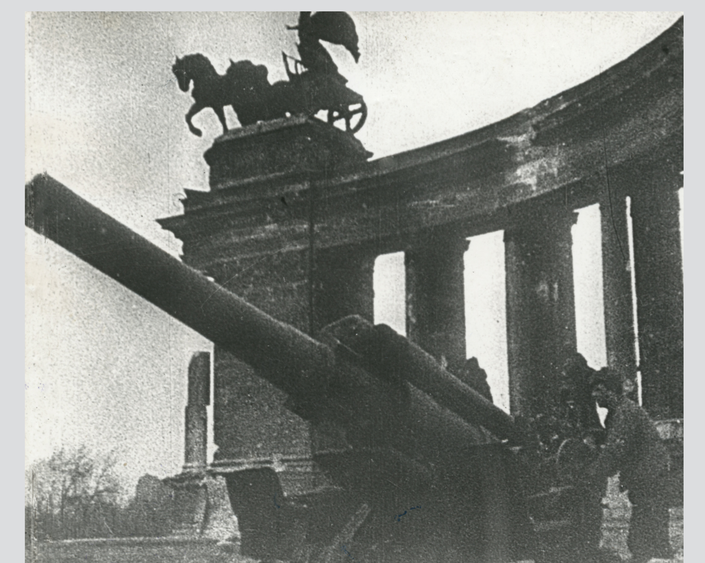
Szovjet ágyú a hősök terén, 1945. február Soviet gun in Heroes' Square, February 1945