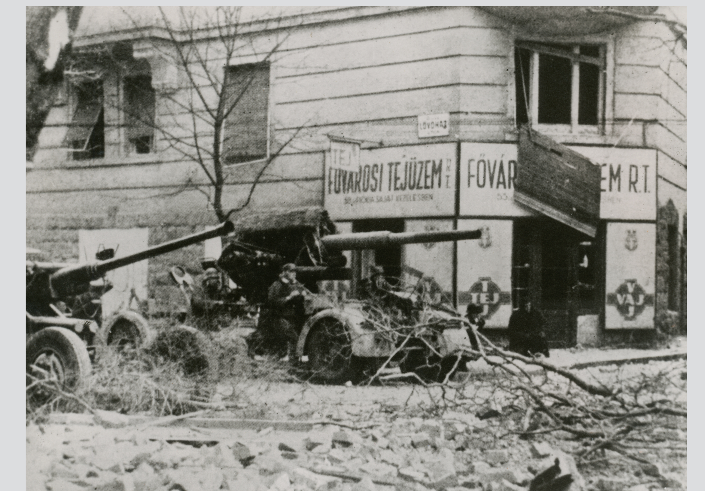
Lövegek Budapesten, a Lövház utcában, 1945. január Guns in Budapest, in Lövház Street, January 1945