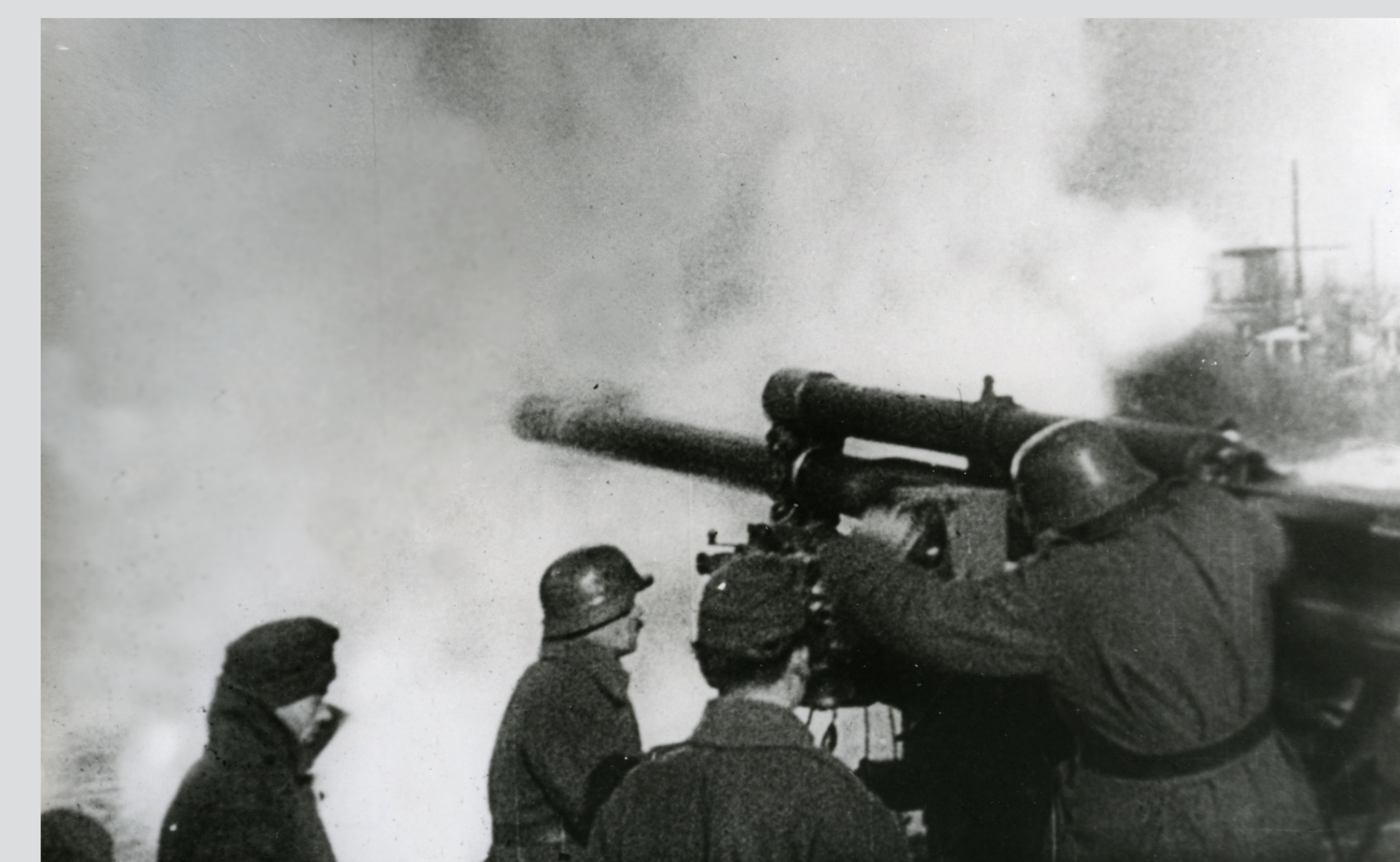
A 102. légvédelmi tüzérsztyály 8 cm-es légvédelmi ágyúja Budapest védelmében, 1944. december An 8cm anti-aircraft gun of the 102nd Anti-aircraft Artillery Battalion in defence of Budapest, December 1944