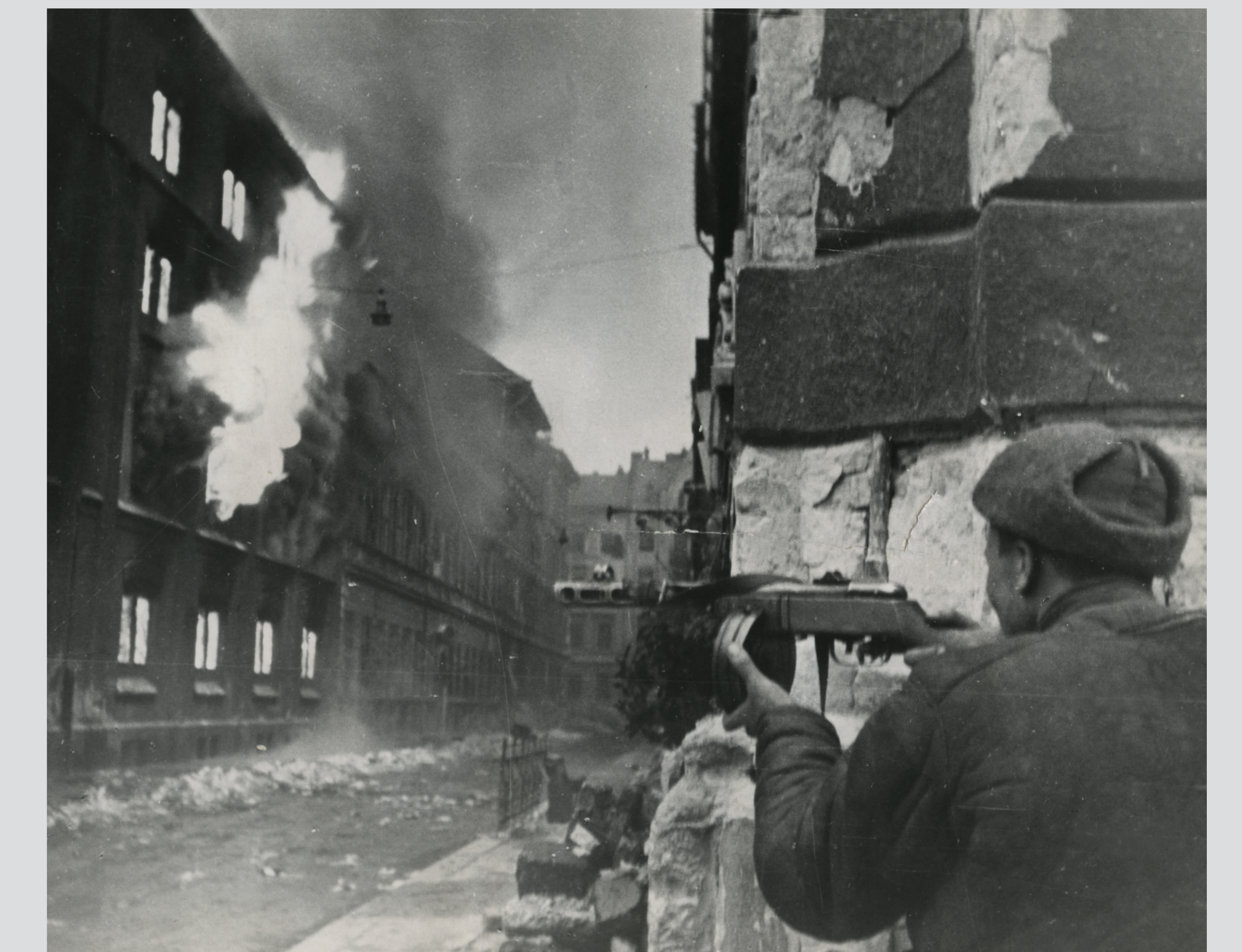
Budapesti utca, 1945. január Budapest street scene, January 1945