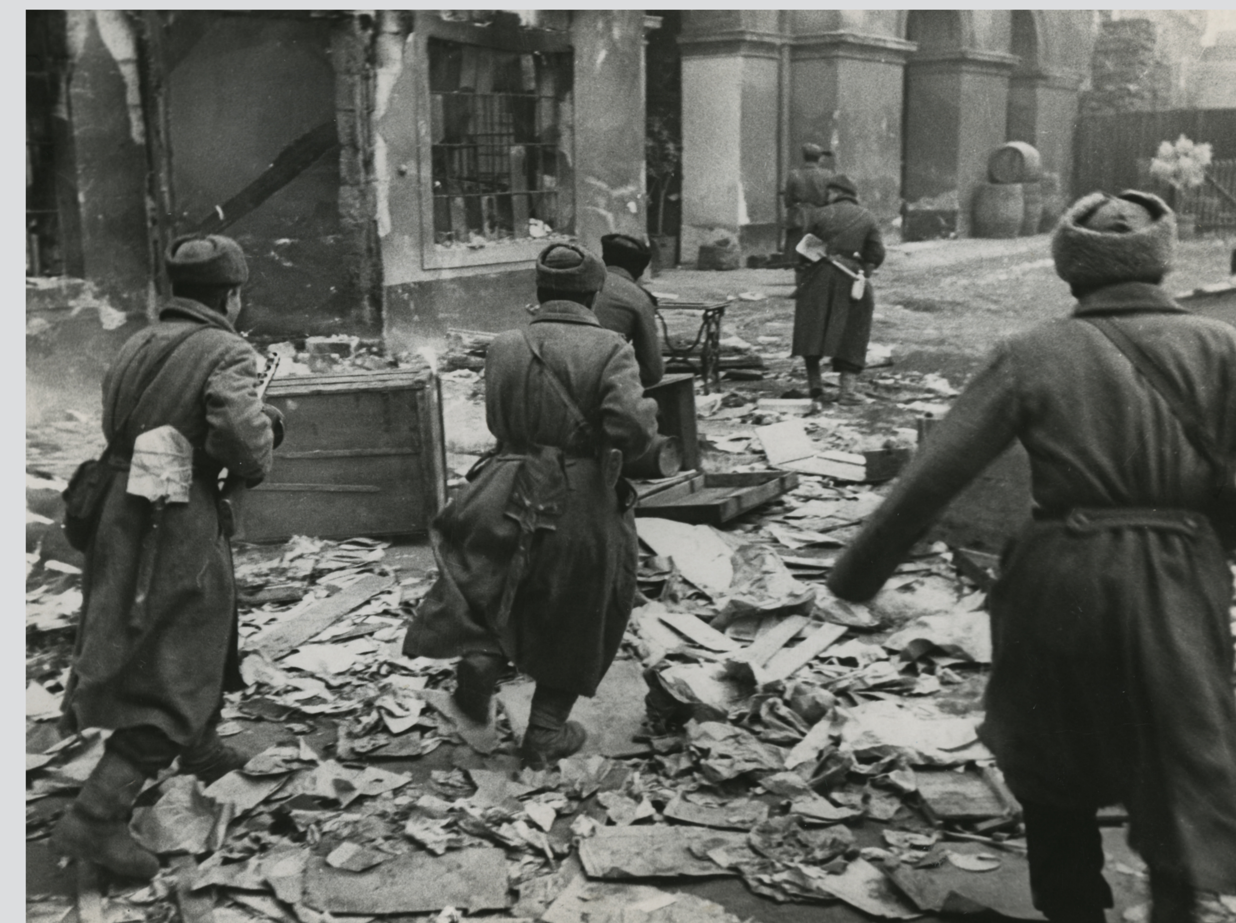
Szovjet rohamcsoport, 1945. január Soviet assault group, January 1945