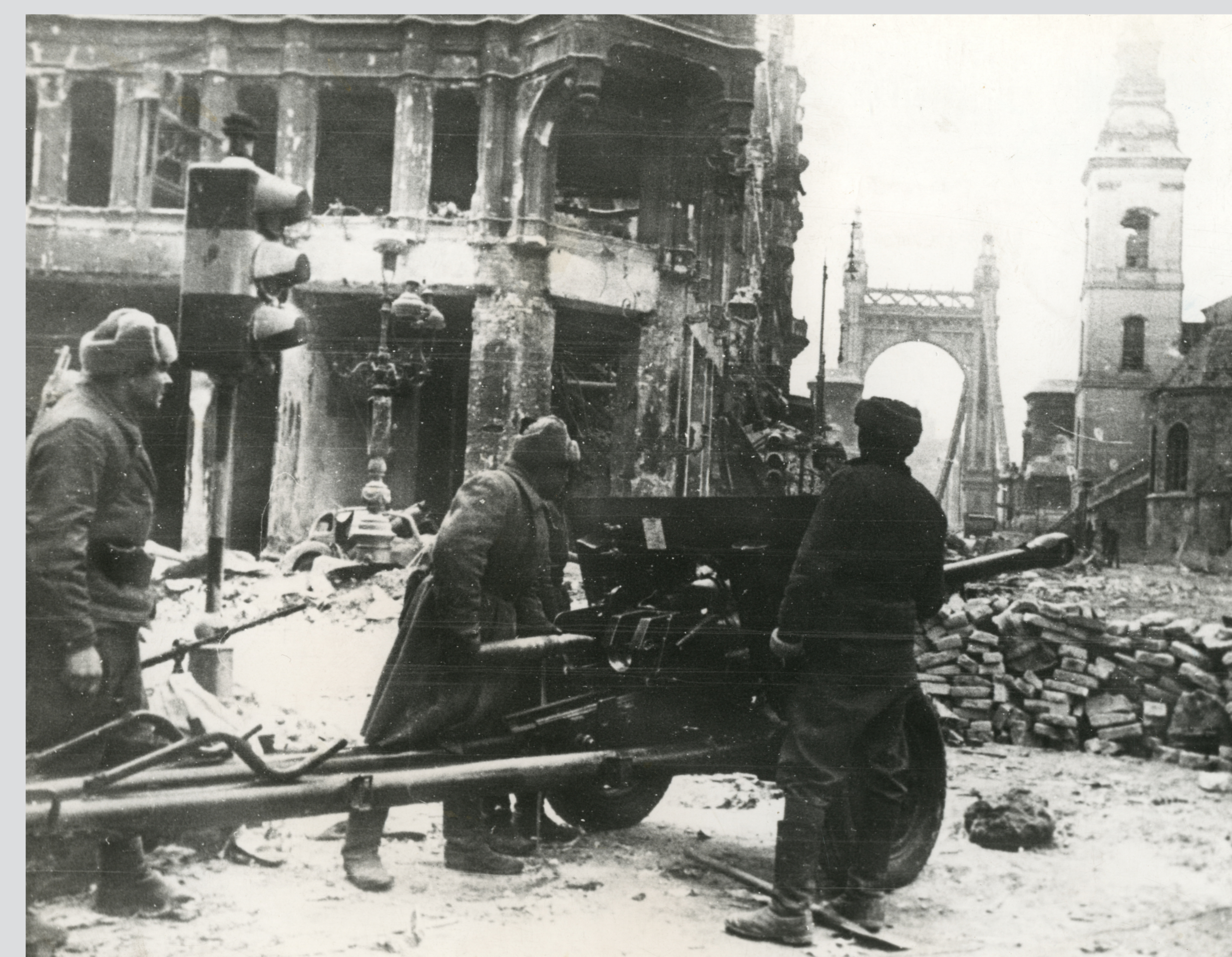
Szovjet tüzérség a Ferenciek terén, 1945. január Soviet artillery in the Square of the Franciscans, January 1945