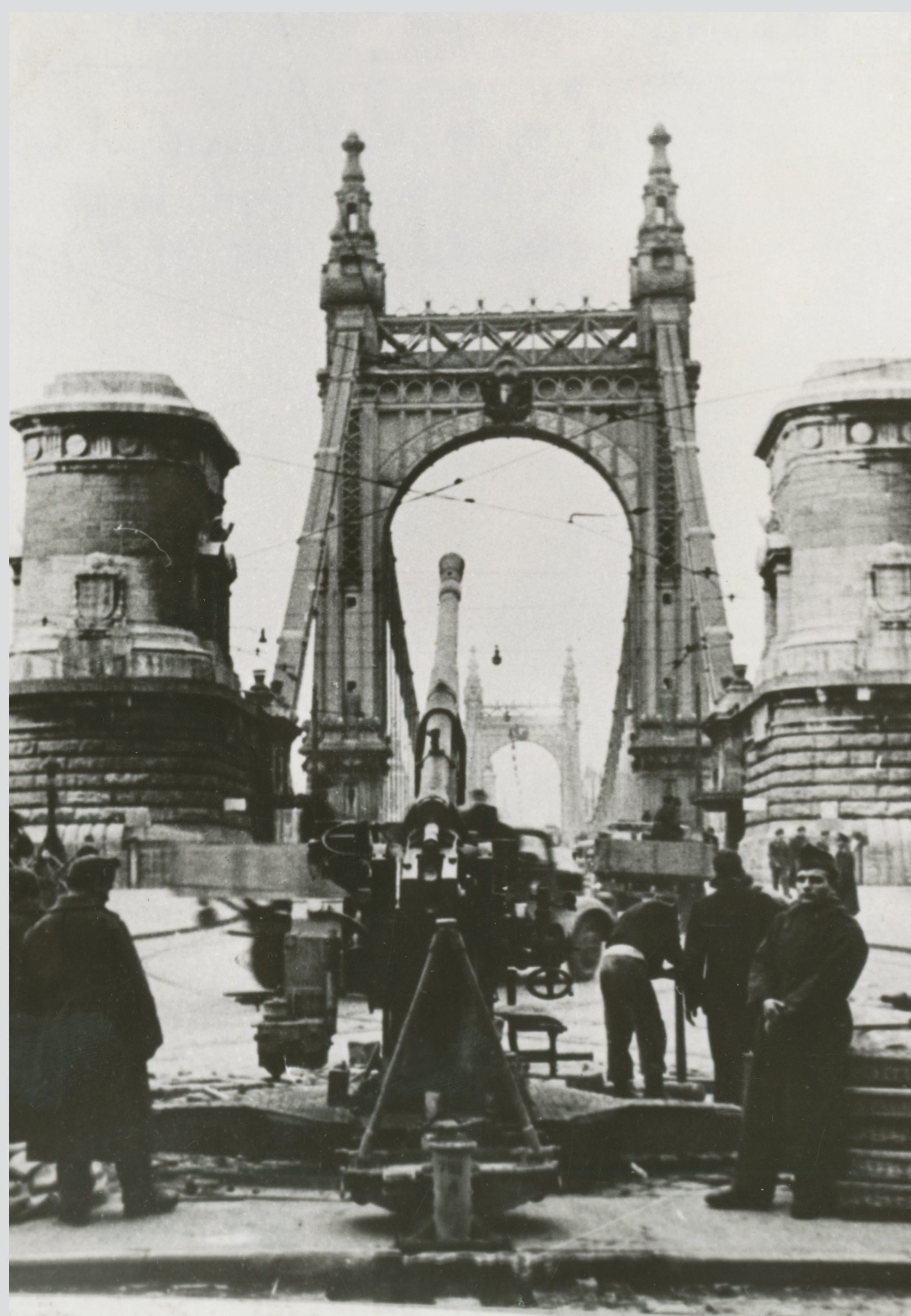
Magyar tüzérek Budapesten, 1945. január Hungarian artillerymen in Budapest, January 1945