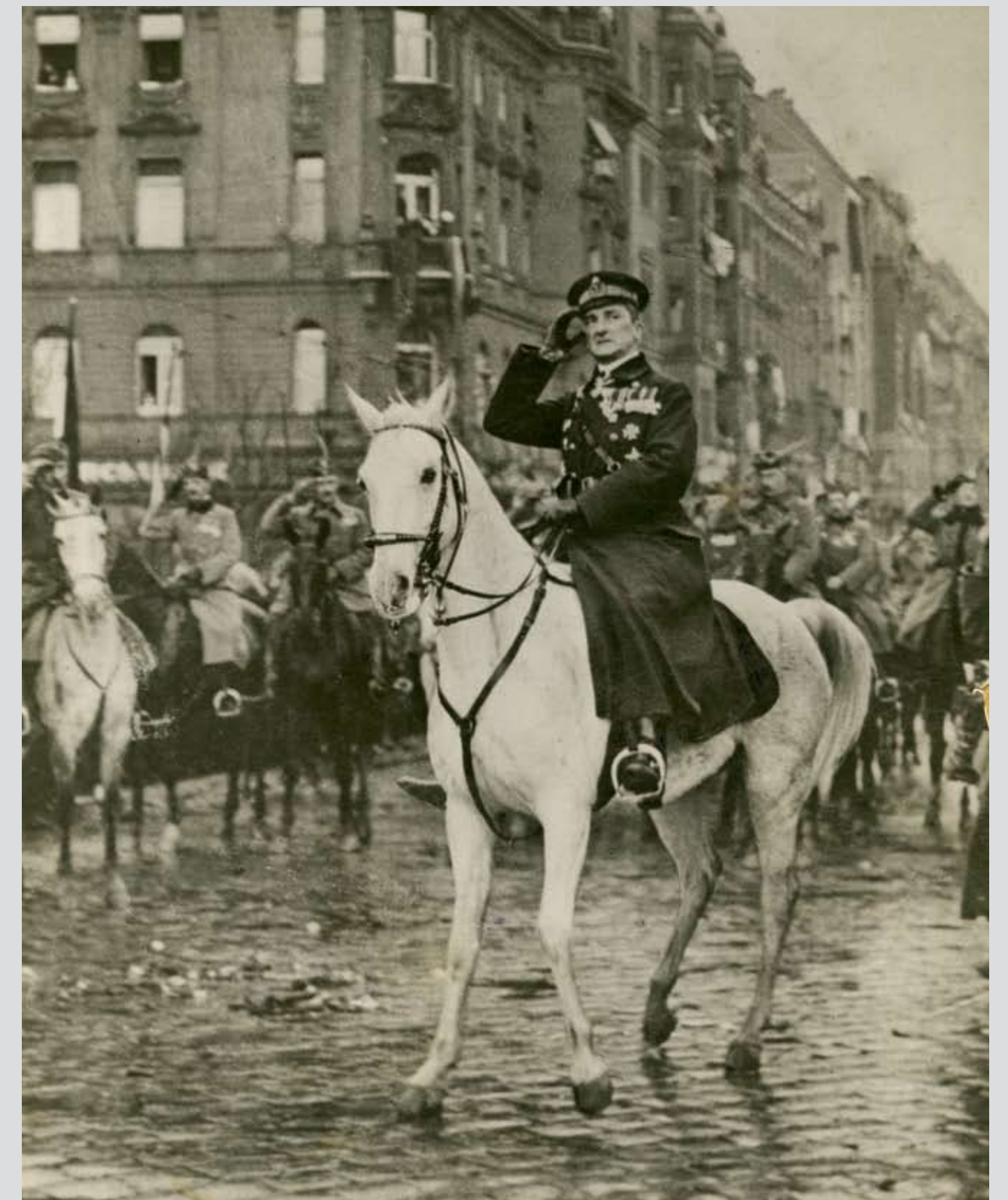
Nagybányai Horthy Miklós altengernagy bevonul Budapestre.

The foundations of the Royal Hungarian National Army were set upon a notice issued on 19 June 1919 by Vice Admiral Miklós Horthy, Minister of War in Gyula Károlyi's cabinet formed in Szeged. The National Army initially comprised armed detachments of officer's and NCO's companies of a few hundred soldiers each. These units were not involved in armed conflicts against the Red Army. The units of the National Army, loyal to Miklós Horthy all the way, rather had a role after the Commune had failed. Their headcount increased to 56,000 until the end of November 1919. Such units took action in the legitimation of Miklós Horthy's power, the restoration of supremacy over Hungarian territories after the Allies' troops had withdrawn, other military activities, and the liberation of Újszeged and Pécs.