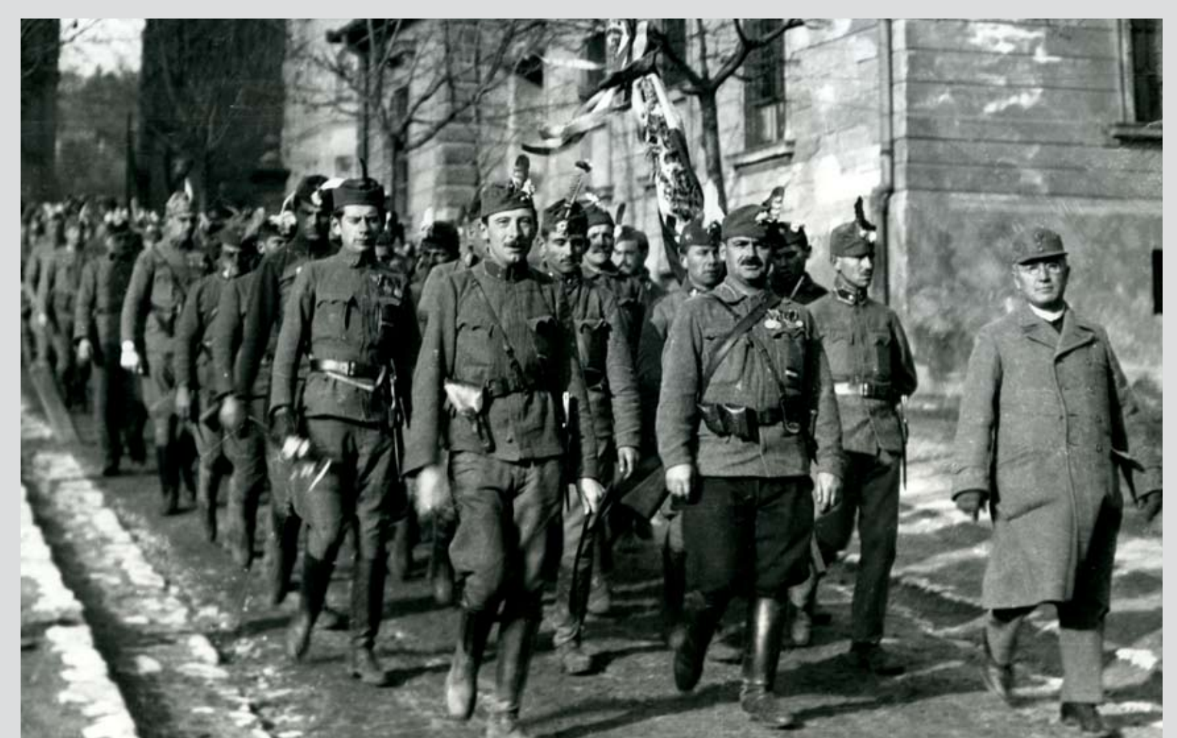
A Nemzeti Hadsereg egyik alakulata egy budapesti utcán,