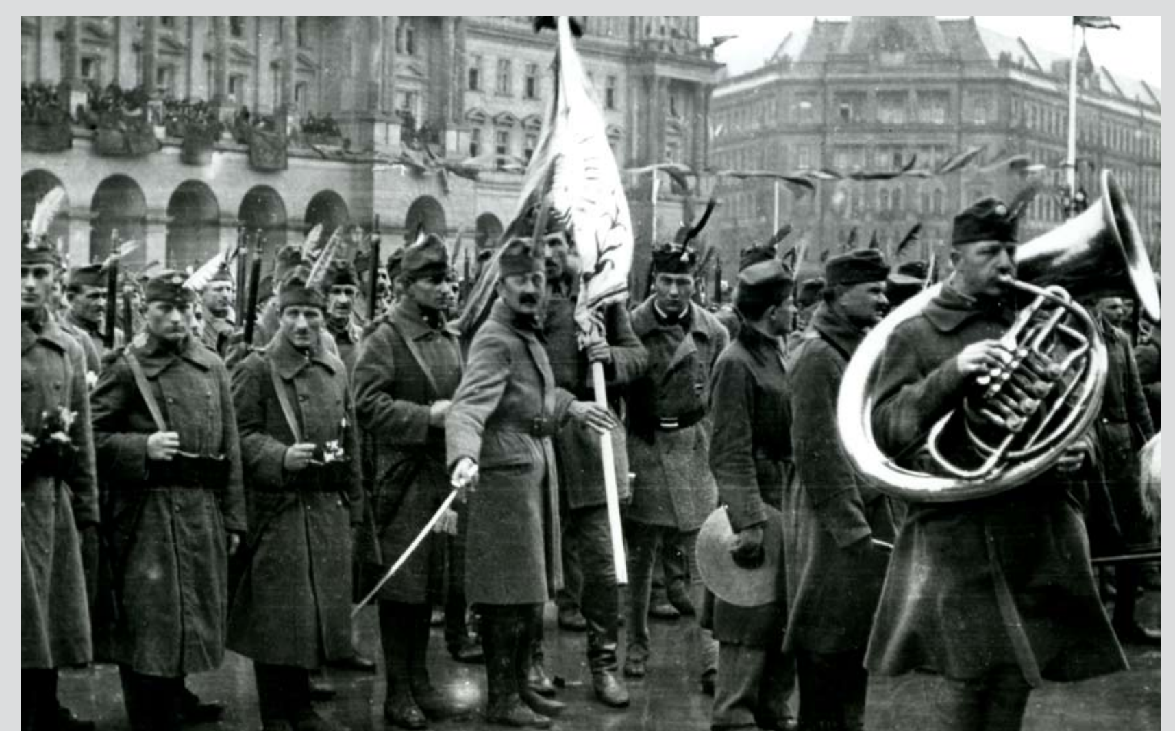
A Nemzeti Hadsereg bevonulása Budapestre,