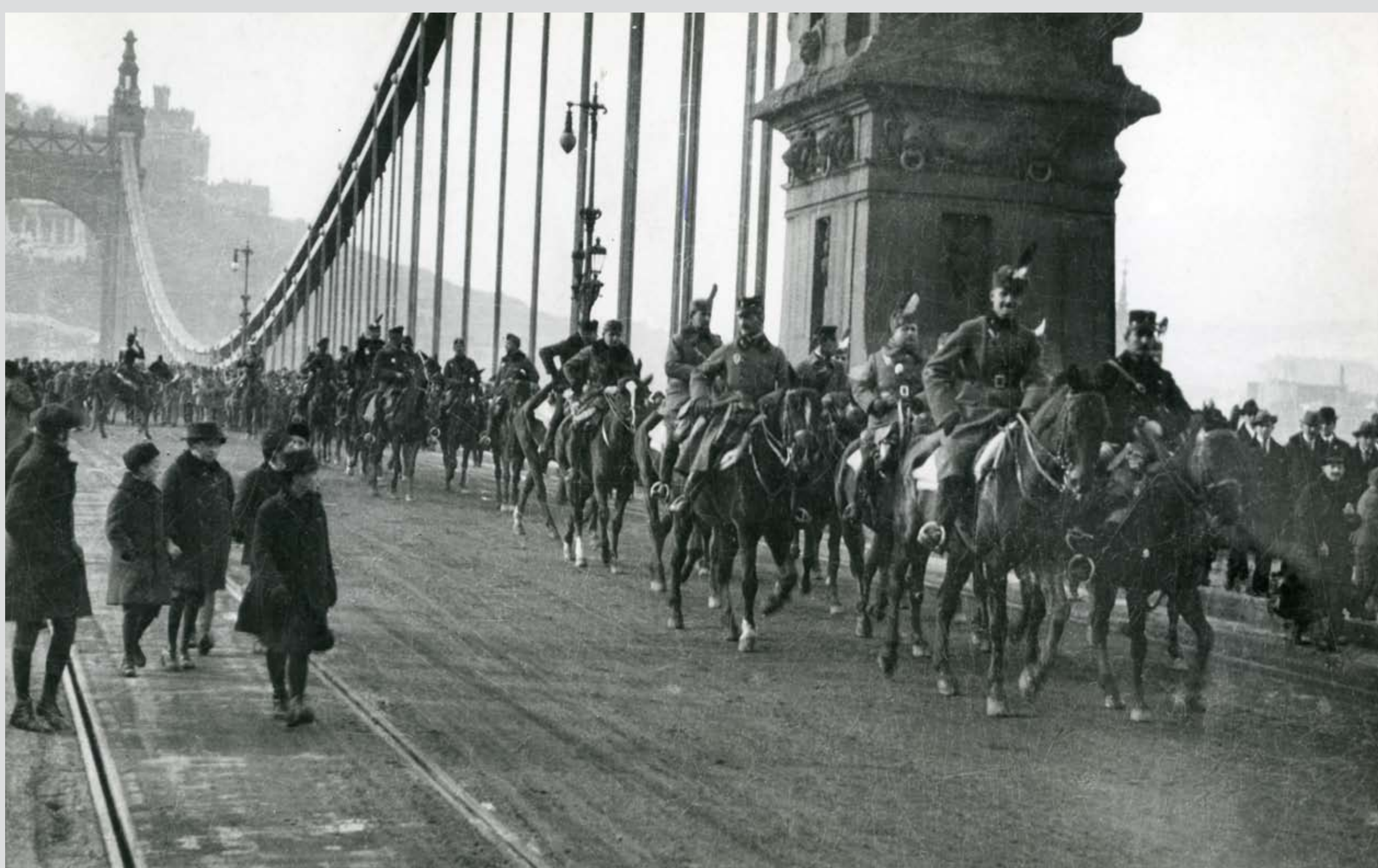
A Nemzeti Hadsereg az Erzsébet-hídon vonul keresztül. Budapest,