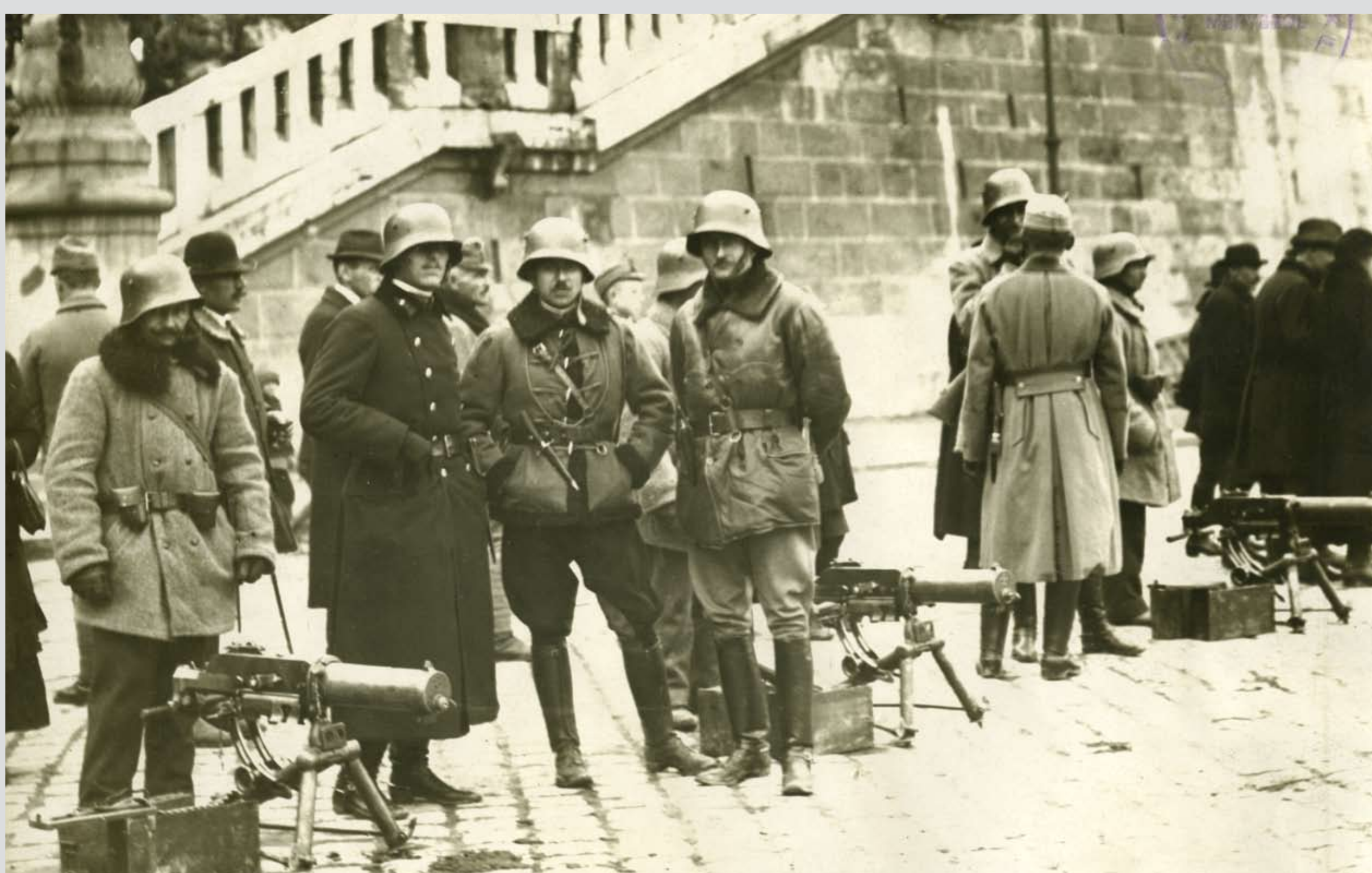
Készültség a Gellért szobor alatt nagybányai Horthy Miklós altengernagy bevonulásakor.