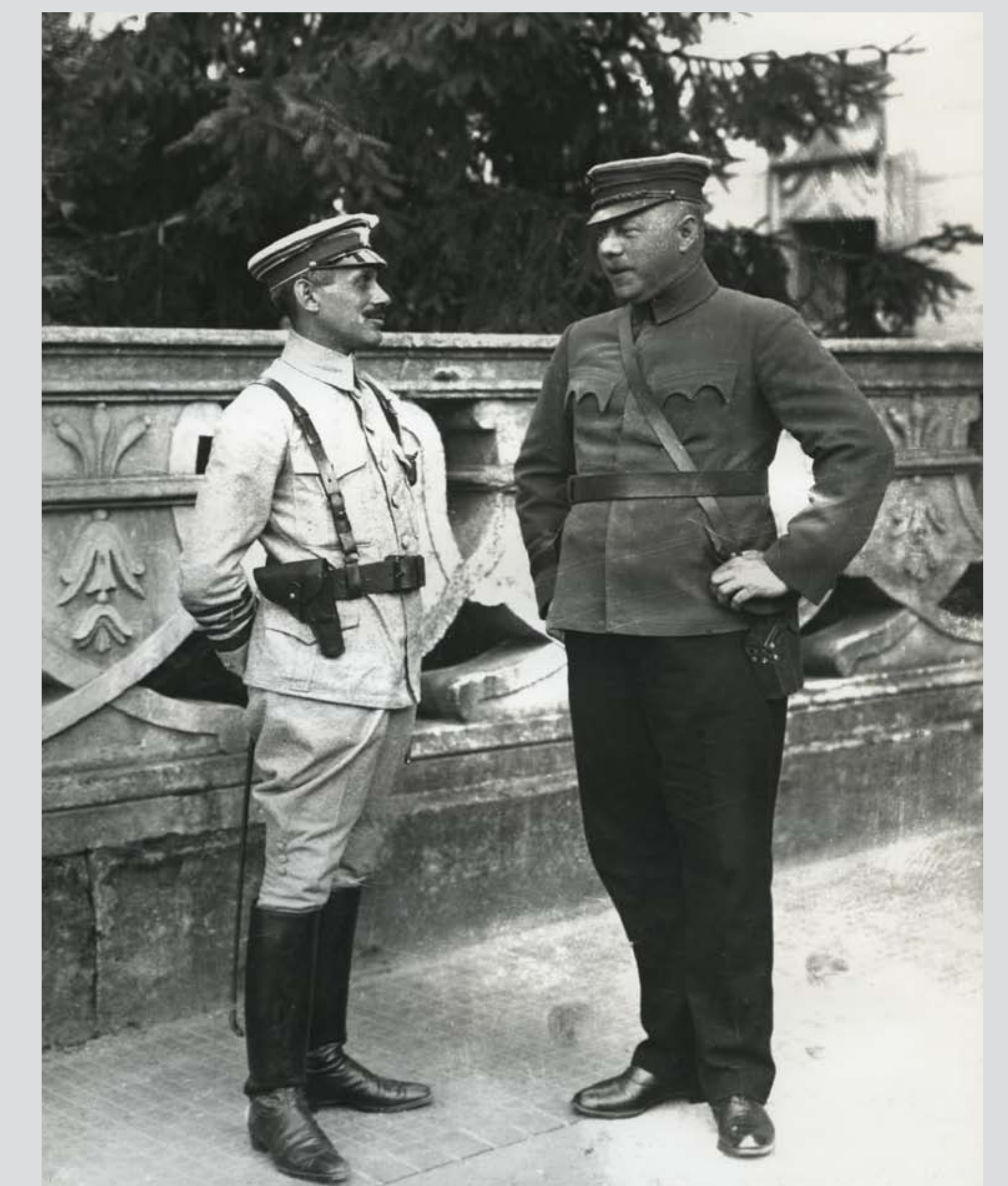
Böhm Vilmos, a Hadügyi Népbizottság elnöke és Stromfeld Aurél, a Vörös Hadsereg vezérkari főnöke. Gödöllői főhadiszállás, 1919 tavaszán Head of the Military Commissariat Vilmos Böhm and the Hungarian Red Army's Chief of Staff Aurél Stromfeld at the Gödöllő headquarters, spring of 1919