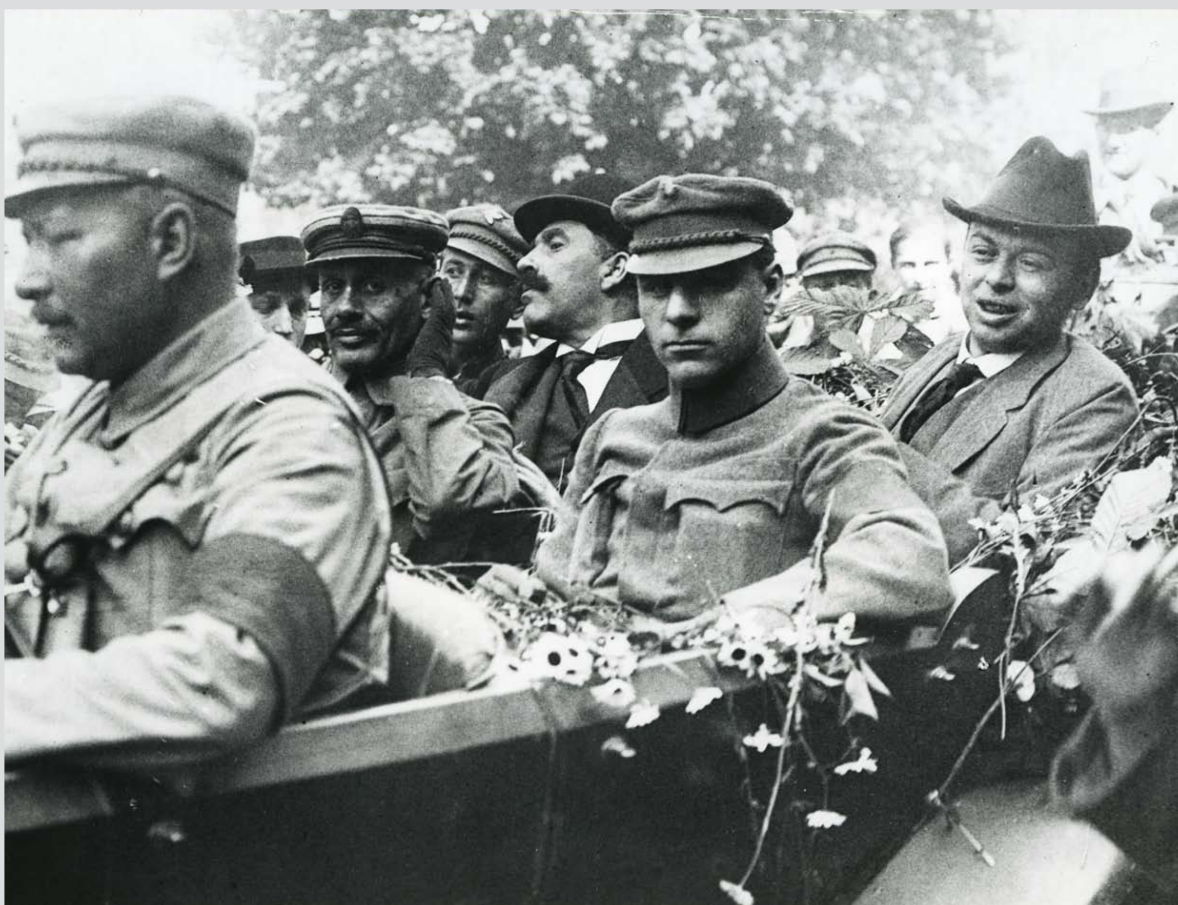
Népbiztosok autója Kassán. Kesztyűben Böhm Vilmos, mellette Szántó Béla könyököl, az ő háta mögött Kun Béla. 1919. június 11. Commissars in Kassa: Vilmos Böhm (wearing gloves), Béla Szántó (leaning on his elbow) and Béla Kun (behind Szántó), 11 June 1919