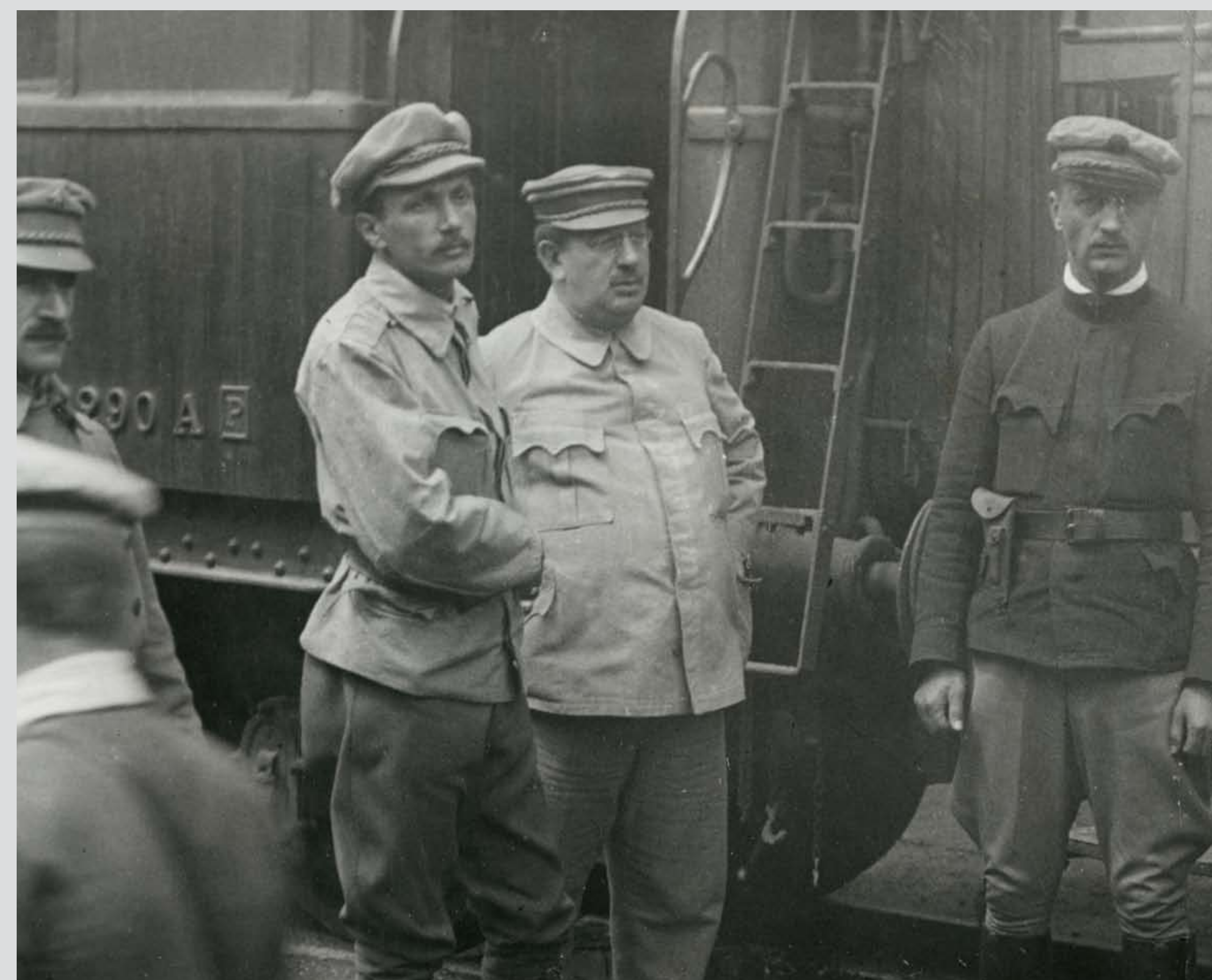
A Vörös Hadsereg főparancsnóságának vonata előtt állnak jobbról-balra: Münnich Ferenc, a hadsereg-főparancsnóság politikai osztályának vezetője, Landler Jenő hadsereg-főparancsnok, Vágó Béla, az I. hadtest parancsnoka, 1919. június 15. Standing in front of the train of the Hungarian Red Army Supreme Command from right to left: the Supreme Command's Political Chief Ferenc Münnich, Army Commander-in-Chief Jenő Landler, and Commander of the I Corps Béla Vágó, 15 June 1919