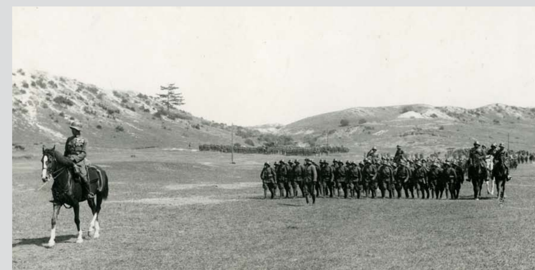
A budapesti 1. vegyesdandár díszmenete a hadgyakorlat után. Piliscsaba, 1925 nyara Parade march of the 1st (Budapest) Mixed Brigade after a military exercise. Piliscsaba, summer of 1925

Troops of the 1st (Budapest) Mixed Brigade at a summer exercise. Among the inspecting superiors and exercise commanders Minister of Defence, Lieutenant General Károly Csáky is seen on the left, with Commander-in-Chief, General of the Cavalry Kocsárd Janky on his right. Piliscsaba, 1925