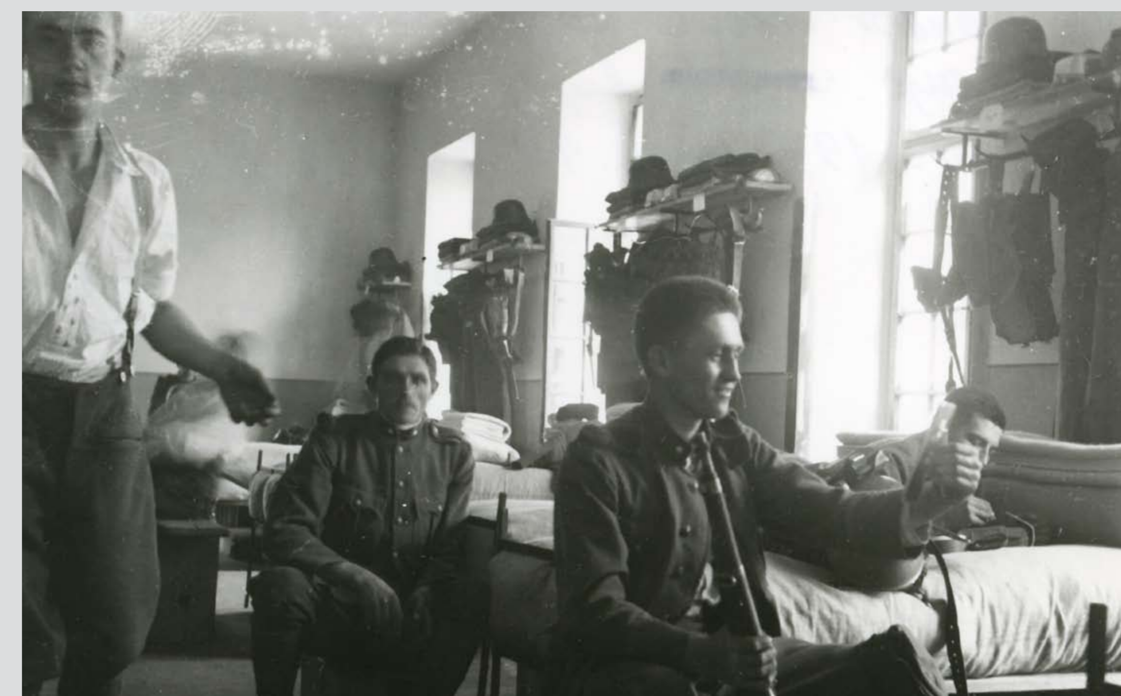
Az 5. gyalogezred egyik kocsizó géppuskás századának körlete. Sopron, 1931–1932 Quarters of a machine-gun company of the 5th Infantry Regiment. Sopron, 1931–1932