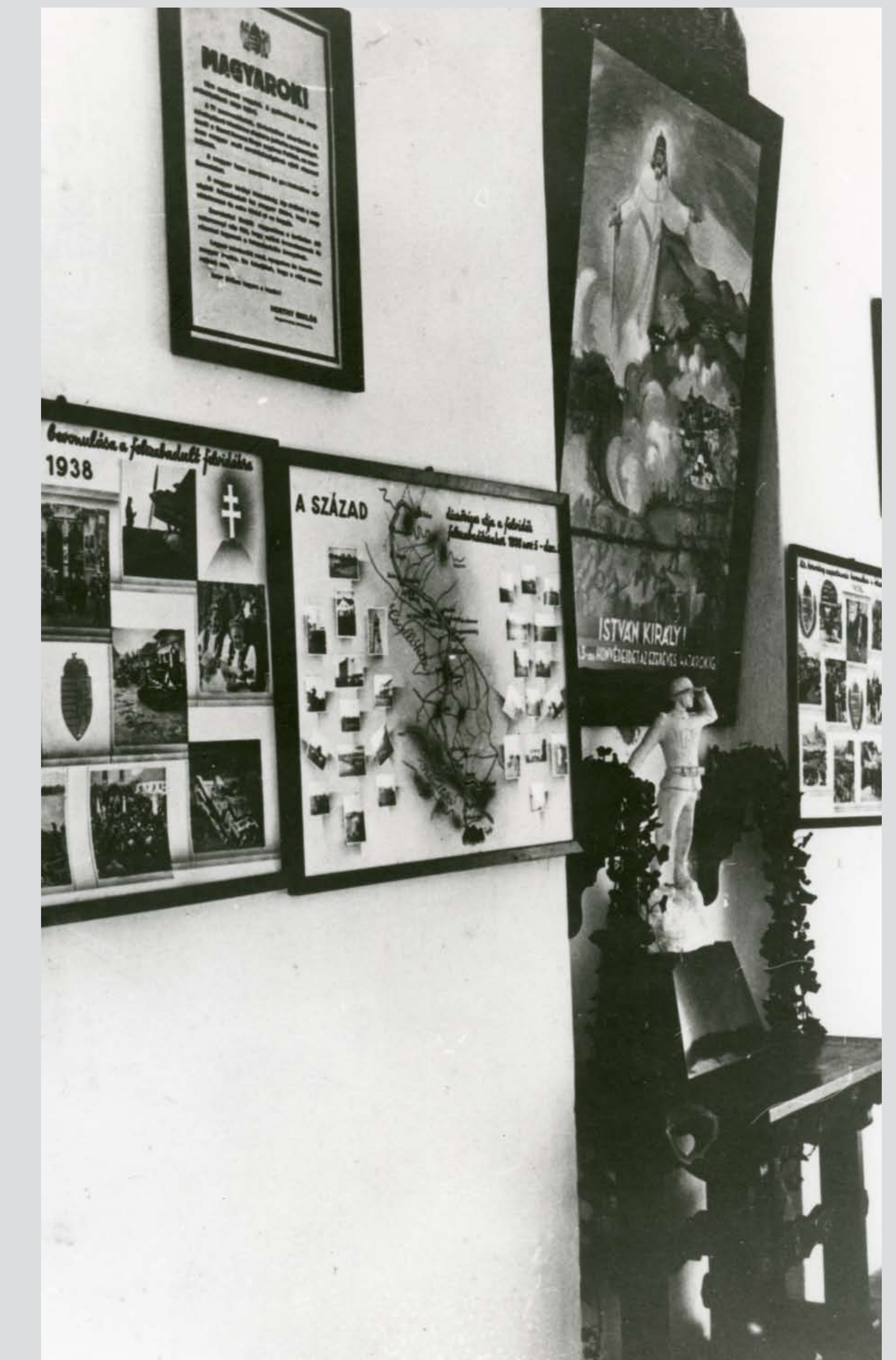
A 3/III. gyalogzászlóalj 9. századának „dicsőség-folyosója” az elhelyezési körletben. A tablók a felvidéki bevonulást mutatják be. Székesfehérvár, 1939 "Glory hallway" in the quarters of the 9th Company of the 3/III Infantry Battalion. The tableaus show the marching into Upper Hungary. Székesfehérvár, 1939