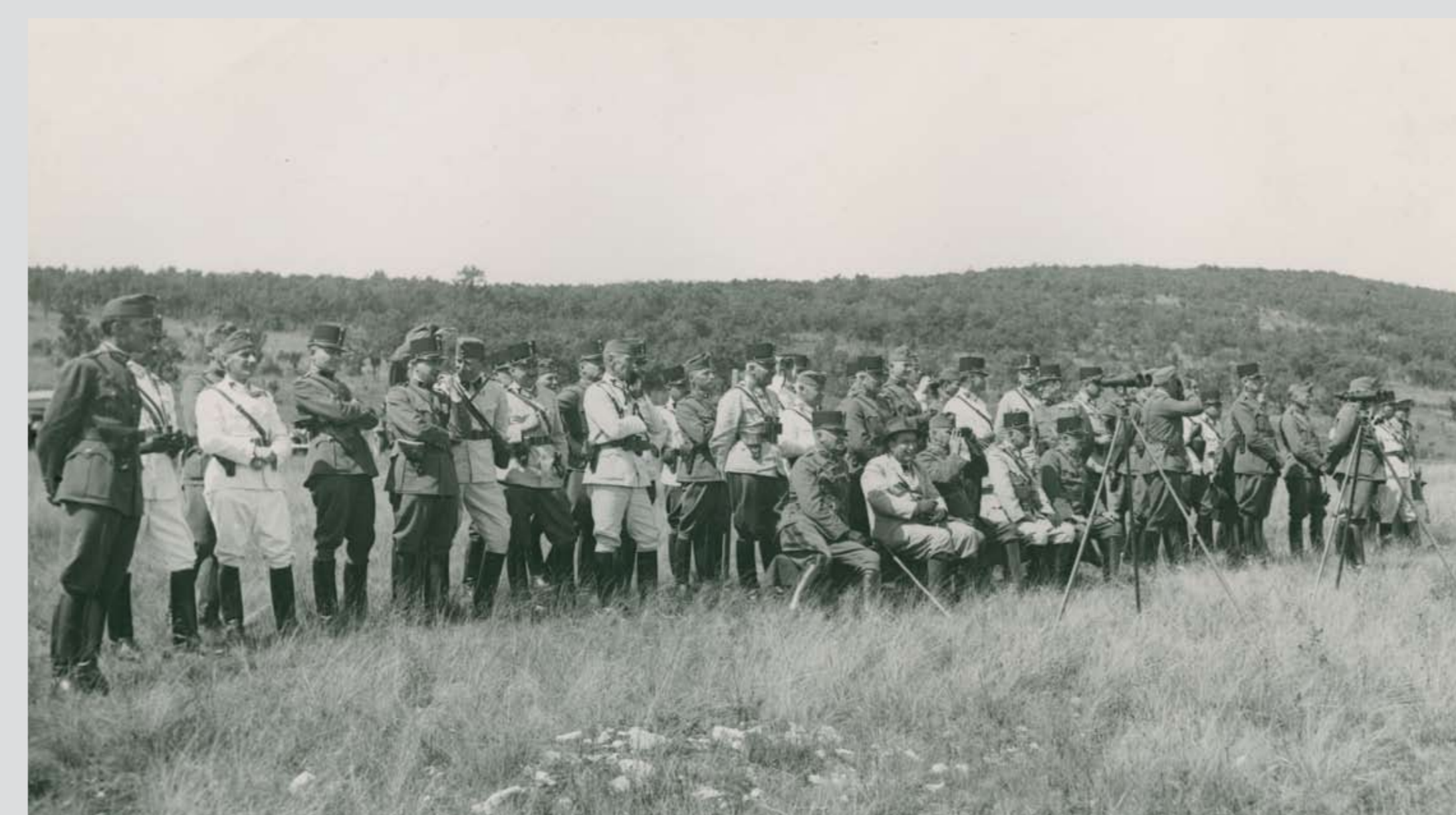
A Honvédség tábornokai megszemlélnék egy aknavetővel végrehajtott bemutató lövészetet. Civilben, balról másodikként Gömbös Gyula miniszterelnök ül. Hajmáskér, 1936 nyara Generals of the Hungarian Defence Forces inspect a demonstration firing with mortars. Wearing civilian outfit, second from the left sits Prime Minister Gyula Gömbös. Hajmáskér, summer of 1936