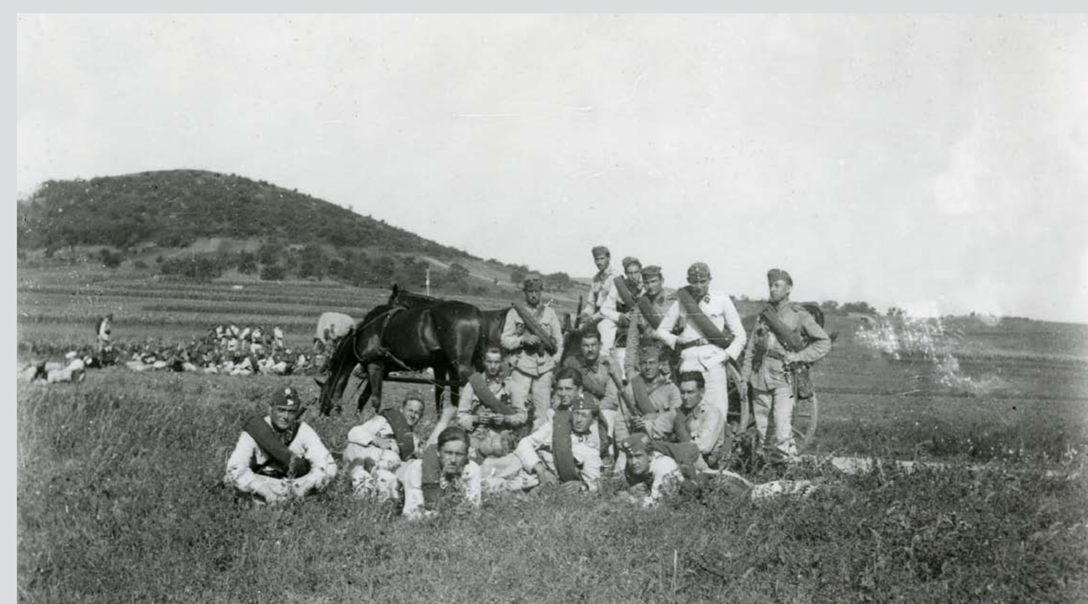
Az 5. gyalogezred egyik kocsizó géppuskás százada gyakorlaton. Sopron környékén, 1932 nyara One of the machine-gun companies of the 5th Infantry Regiment at an exercise. Near Sopron, summer of 1932