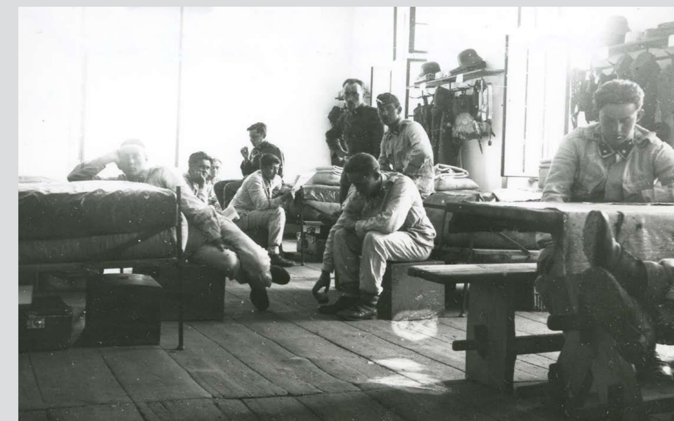
Az 5. gyalogezred egyik kocsizó géppuskás századának körlete. Sopron, 1931–1932 Quarters of a machine-gun company of the 5th Infantry Regiment. Sopron, 1931–1932