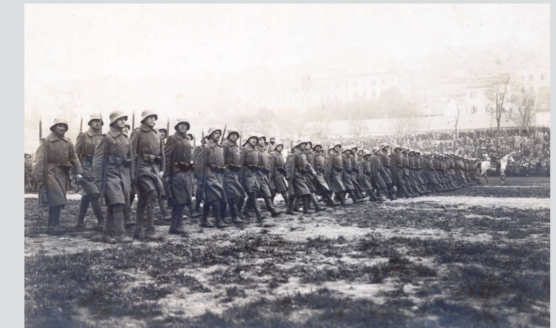
Csapat szemle a Vérmezőn. Budapest, 1920-as évek Troop inspection in Vérmező. Budapest, 1920s