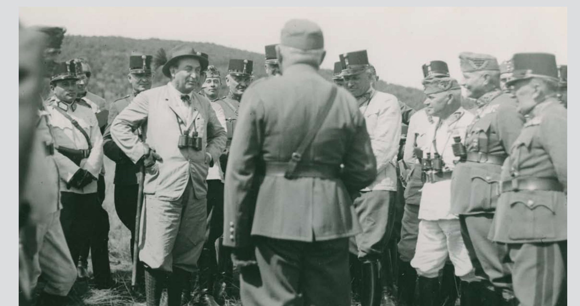
Gömbös Gyula miniszterelnök a Honvédség tábornokaival megszemléli egy aknavetővel végrehajtott bemutató lövészetet. Hajmáskér, 1936 nyara Prime Minister Gyula Gömbös with the Generals of the Hungarian Defence Forces inspecting a demonstration firing with mortars. Hajmáskér, summer of 1936