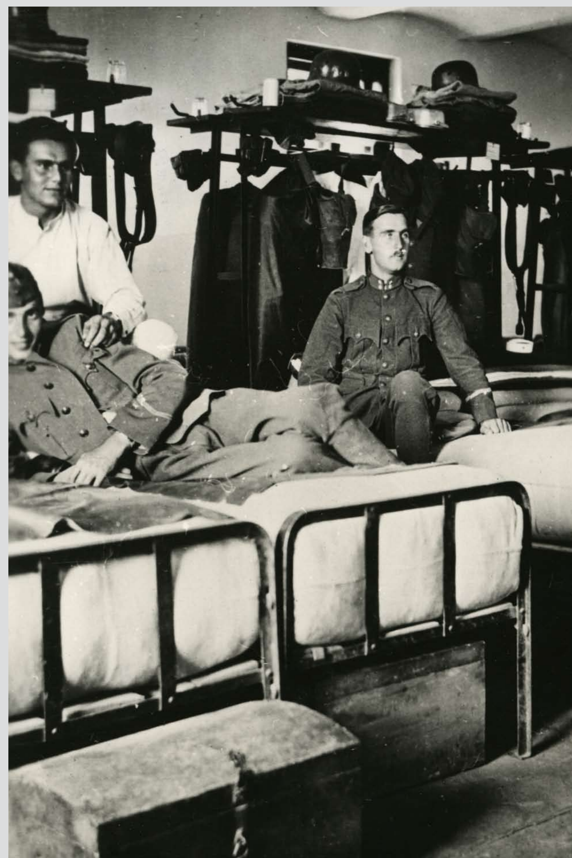
A honvéd gépkocsizó csoport karpaszományosainak körlete. Hajmáskér, 1935 Quarters of the motorized group's one-year volunteers. Hajmáskér, 1935