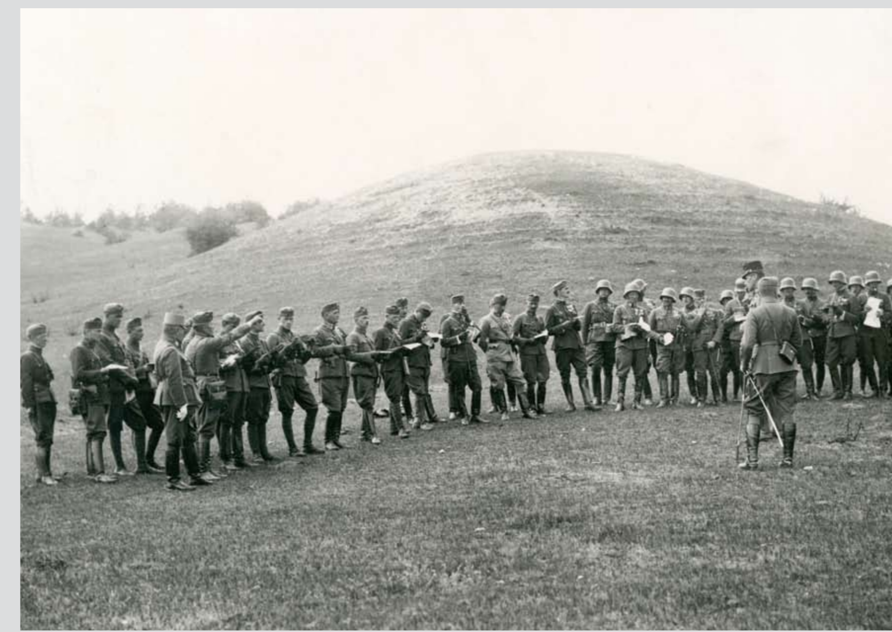
A budapesti 1. vegyesdandár csapatai nyári kihelyezésén. A szemlélő előljárók és a gyakorlatvezetés tagjai között balszélen Csáky Károly altábornagy, honvédelmi miniszter, tőle jobbra nemes bulcsi Janky Kocsárd lovassági tábornok, a Honvédség főparancsnoka. Piliscsaba, 1925

Horse-drawn and motorized (towed) 15cm howitzers were put in order of battle to complement the light cannon and howitzer batteries of artillery regiments. The rapid deployment branch of the army comprised bicycle, hussar and tank units. Four hussar regiments, organised in two brigades, were subordinated to a cavalry division. The cavalry, including the cavalry squadrons of the mixed brigades, consisted of 31 squadrons in total.