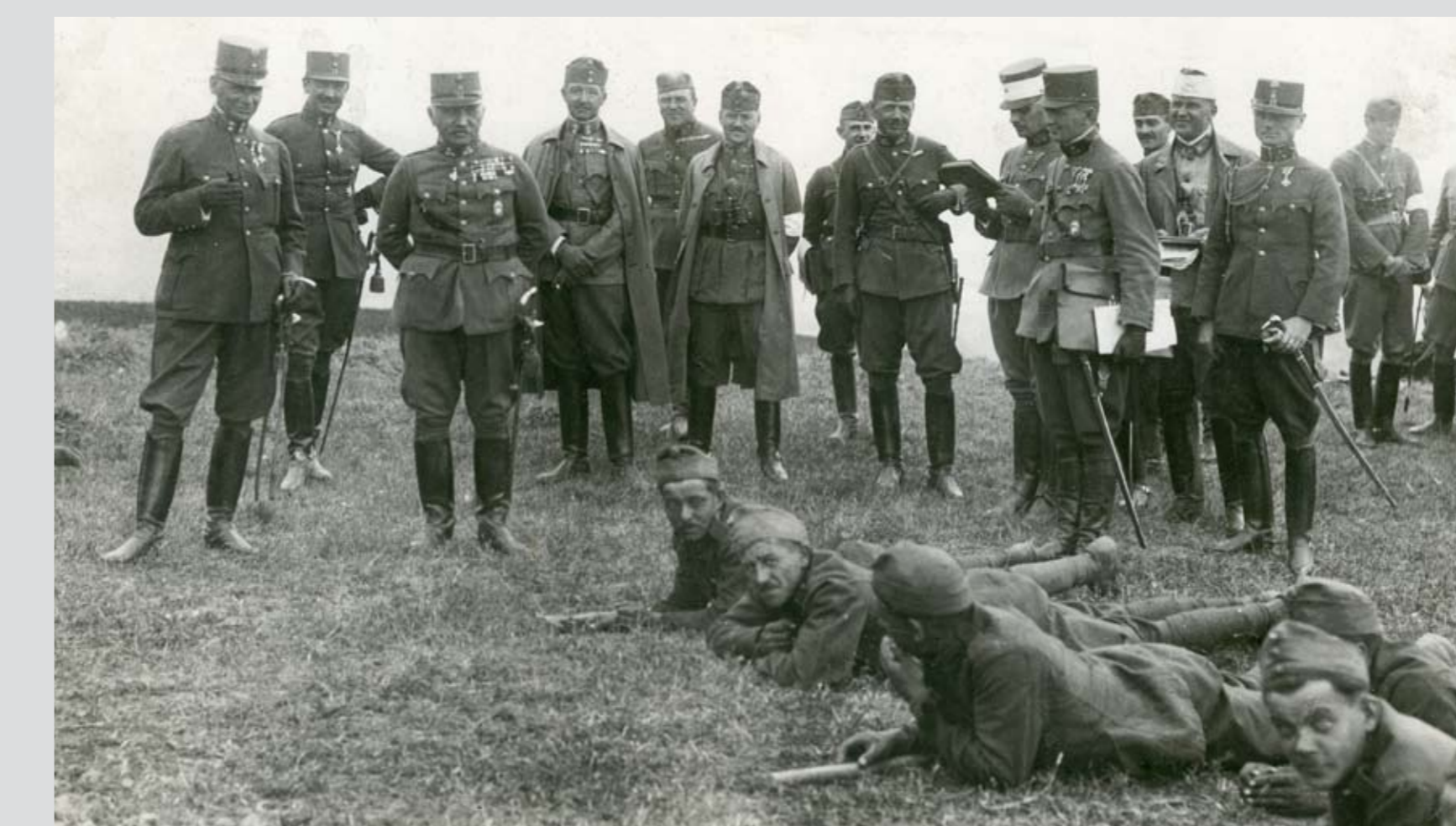
Tisztek megbeszélése a budapesti 1. vegyesdandár nyári kihelyezésén. Piliscsaba, 1925 Briefing of officers at the 1st (Budapest) Mixed Brigade's summer exercise. Piliscsaba, 1925